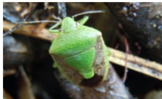
写真1 チャバネアオカメムシ