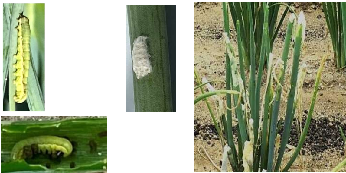
写真 シロイチモジヨトウ幼虫(左2枚)と卵塊(中)、ネギの被害(右)