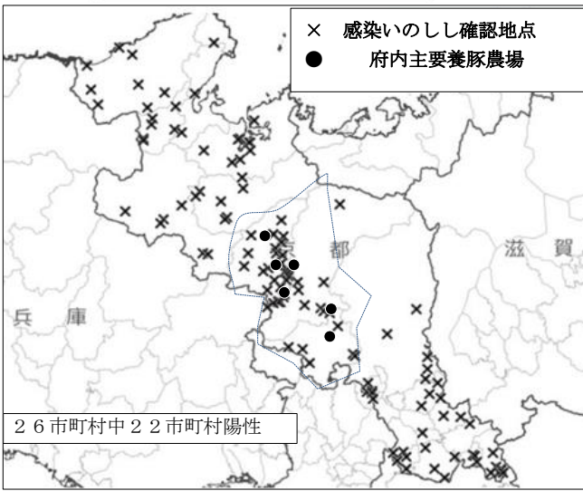
府内野生いのしし豚熱陽性確認状況