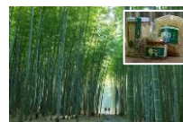
竹林を多分野で利用した観光事業