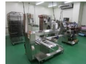
農産物処理加工施設