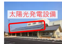
販売・交流施設等