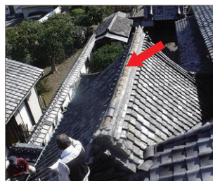
〈修理前〉 棟瓦が破損

長福寺は真言宗泉涌寺派の寺院、1784（天明 4）年、恭礼門院が再興し、桜町・桃園・後桃園の三天皇の菩提を弔い皇室ゆかりの寺となり、明治時代には久邇宮飛呂子女王 くにのみや も修行されました。山門をくぐると正面にある大玄関は、明治時代のもので桁行 3 間、梁行き 2 間の正面入母屋造です。平成 30 年度の台風により、棟瓦などが破損し雨漏りがしたため、屋根の部分修理が行われました。