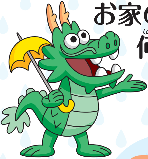
どんりゅう たろう 呑龍 太郎

きょうとふ 京都府ではみんなのくらしをよりよくするため、 うち やね ふ あまみず た お家の屋根に降った雨水を貯められる うすい 雨水タンクの設置をおすすめしています。