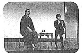
平成29年 対談の様子