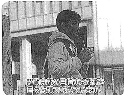
躍動京都の目指す京都像を 目々街頭で訴えています。

躍動する京都の実現には、これまで以上に京都府と京都市の連携が不可欠になります。私も引き続き努力します。