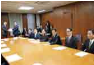
10月30日(月)に「意見・提言」として知事に手渡しました。