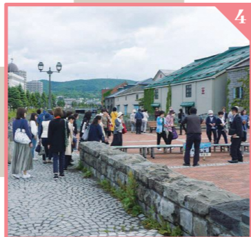
北海道では現地を視察することで学びを得る時間もありました。(※視察先は変更が生じます。)