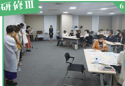
宿泊研修後に事後研修を行います。研修Ⅱでの学びを活かしてどのようなことができたのか話し合い、全体を通しての成果を発表しました。