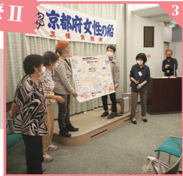
事前研修で設定した課題についてグループごとに議論し、成果を発表しました。