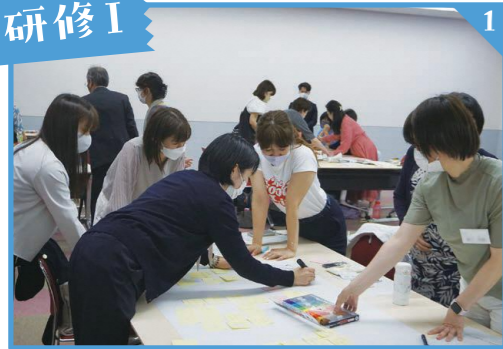
宿泊研修前に事前研修を行います。オリエンテーションで参加者同士の交流の後、グループごとに課題を設定しました。