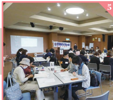
北海道で活躍している女性との交流を行いました。実際の活動の様子を知ることによって多くの学びを得ました。