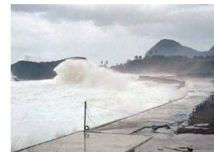
冬の日本海の状態

また、冬季は北西方向からの強い風が多く、この季節風による荒波が押し寄せます。丹後半島の先端 きょうがみさき 経ヶ岬では、京都市内に比べ3倍以上もの強風が吹き付けます。