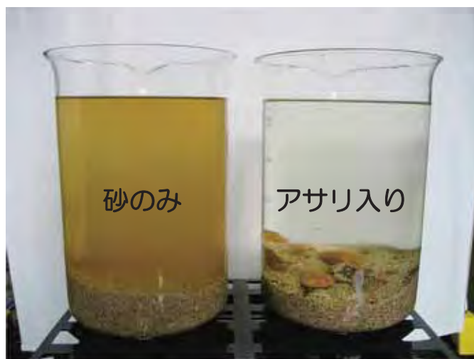
図3 アサリの濾水能力実験 (30分後)

このようにアサリは阿蘇海環境改善に貢献していますが、なかなか実感として感じる事ができません。そこで、その実力を見ていただくため、アサリの濾水能力の高さを示した実験を紹介します(図3)。砂を敷き、一方にはアサリを入れ、もう一方には何も入れないビーカーをセットし、そこへ同量の植物プランクトンを入れて、その後の水色変化を観察しました。30分経過後には、アサリを入れていないビーカーの水色は変わりませんが、アサリを入れたビーカーの水色は完全に無色透明になりました。1kgのアサリが1日に海水を濾過する水量は約4m 3 であり、なんと200%のドラム缶20本分の量に相当します。