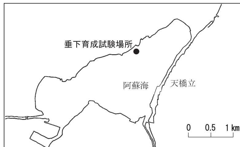
図1 阿蘇海の試験場所

阿蘇海の水質は、高度経済成長期から人為的な汚濁負荷が増加することにより悪化しており、現在、阿蘇海は自然の作用で浄化できる汚濁負荷の2倍もの汚れが流入していると言われています。その結果、漁獲量の減少や悪臭の問題などこの地域を支えている水産業や観光業などに大きな影響を与えています。