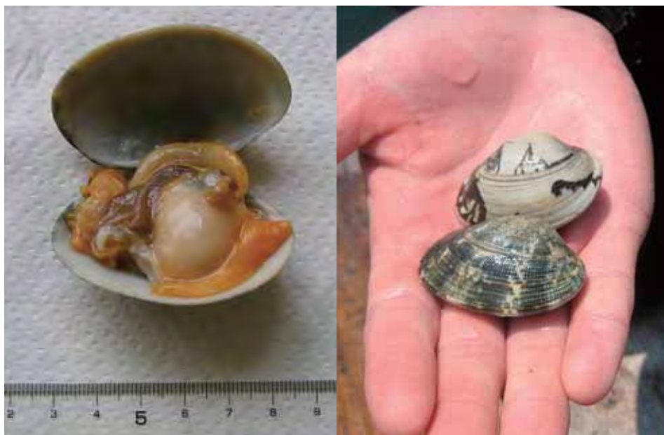
垂下育成したアサリ