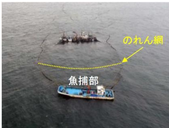
のれん網を設置した定置網での操業風景

本調査は今年度で終了しますが、今後も京都府の漁業の発展に寄与するため、様々な調査・研究に取り組んでいきます。