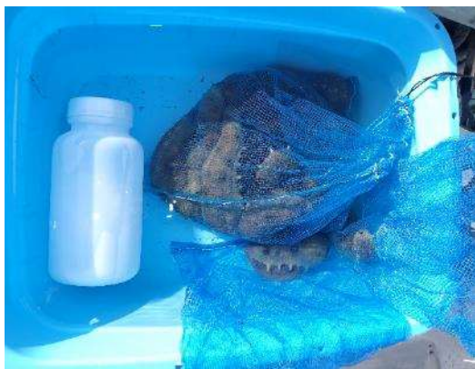
資源状況調査で採捕されたナマコ

今後、データを詳細に解析し、令和 5 年度漁期の適切な資源管理策を漁業者に提案予定です。