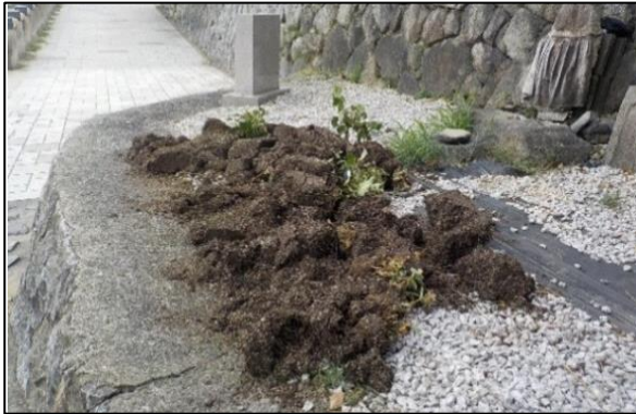
プランターがひっくり返され、みそそぎ川に投げ込まれる（令和4年8月）