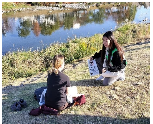
第4回鴨川合同パトロール「昼の部」（令和5年11月22日）