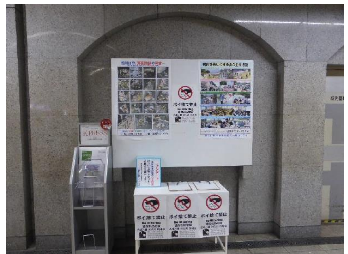
鴨川ごみ問題アンケート（令和5年10月／京阪三条駅）