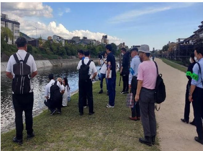
第1回鴨川合同パトロール（令和5年9月1日）