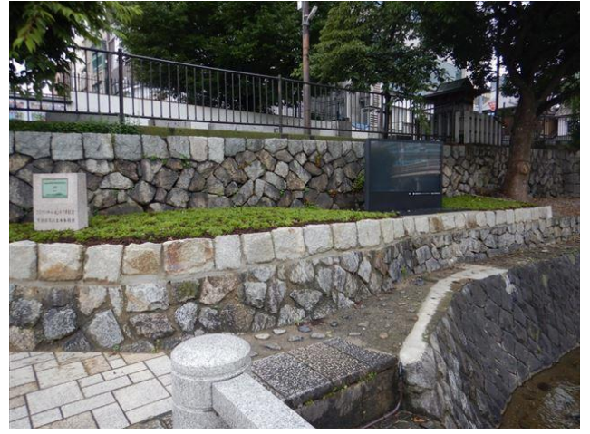
スロープ下花壇の石積の高さを上げた整備を実施（令和5年6月）