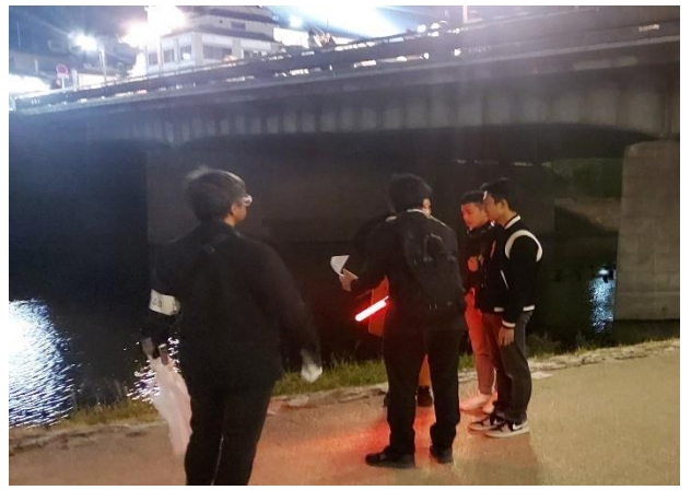
第4回鴨川合同パトロール「夜の部」(令和5年11月22日)