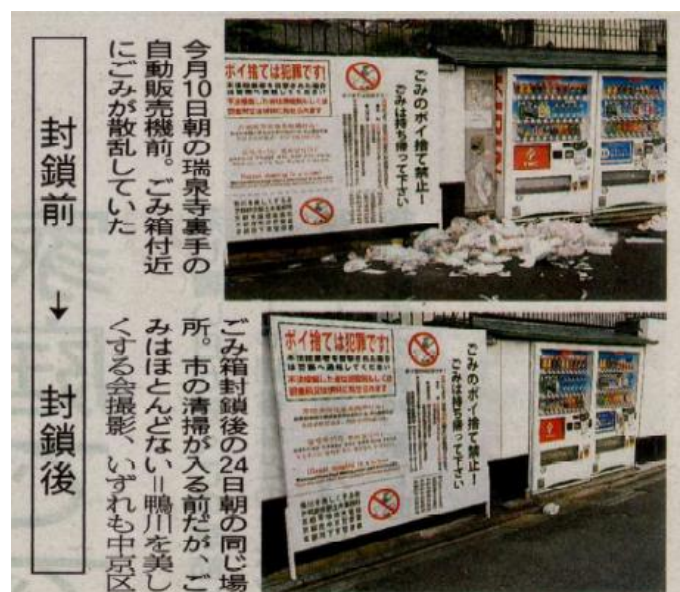
ごみ箱の封鎖（平成29年7月）