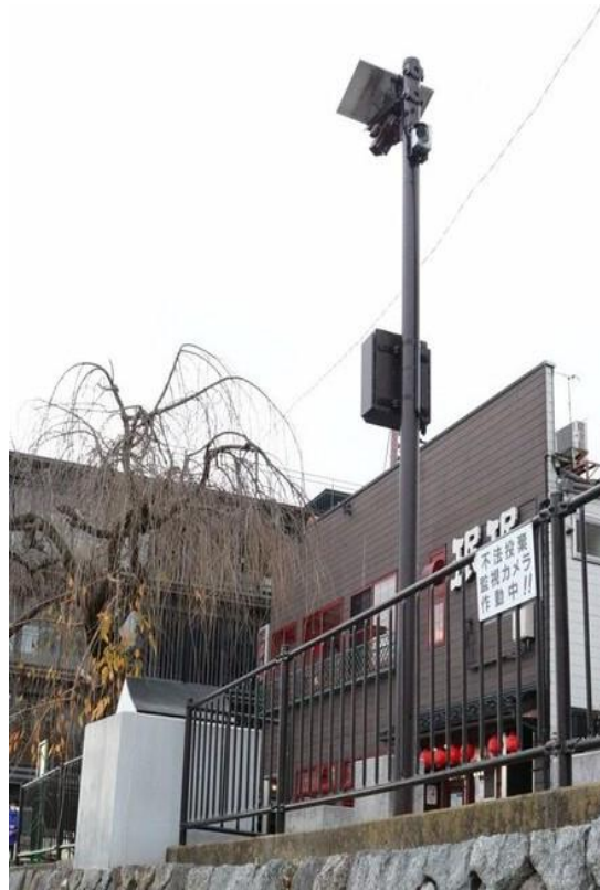
河川敷監視カメラ設置（令和4年11月）