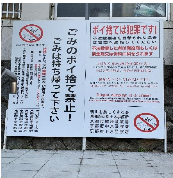
ごみのポイ捨て看板の設置（平成29年7月）