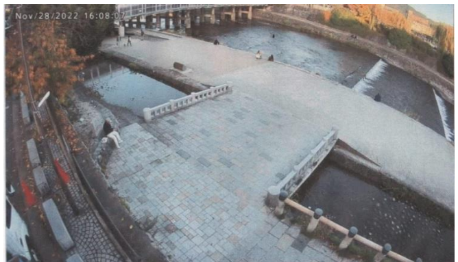
監視カメラの画像