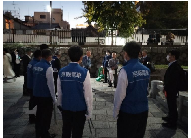
第2回 鴨川合同パトロール（令和5年11月2日 京阪電鉄ほか民間企業と共同実施）