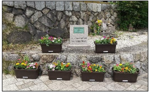
花のプランターの設置（令和4年6月）