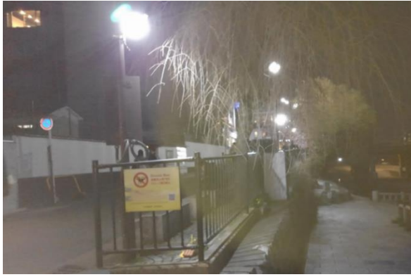
LED 照明装置の設置（令和4年3月）