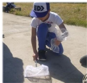
みんなでたくさん虫を捕まえました！