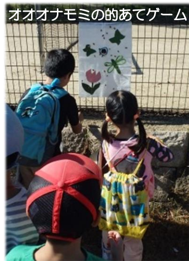
オオオナモミの的あてゲーム