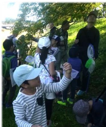
おいしそうに熟したムクの実を探して、ぱくり。