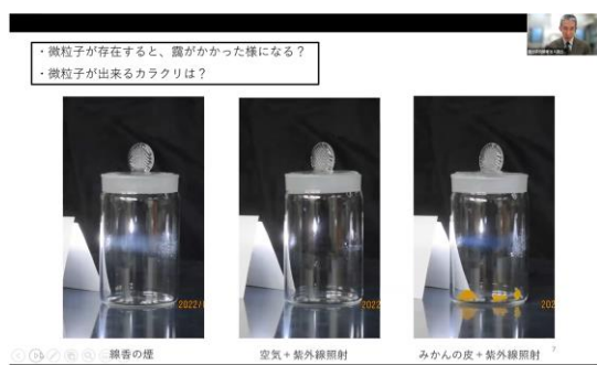
〈今村氏ご講演の様子〉