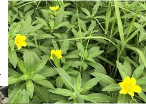
オオバナミズキンバイ