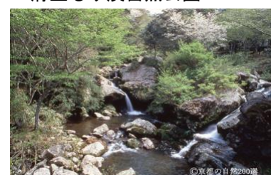
府立るり溪自然公園