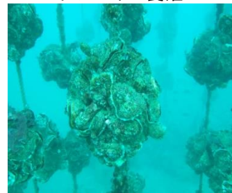
写真3-2-14 イワガキの養殖

また、河川においては、漁業協同組合が、魚が産卵しやすい環境づくり等を通じて魚類の保護増殖に努めているほか、水辺に降りる道の管理や駐車スペースの確保等、釣りを通じて府民が川の自然に親しむ環境整備を行っていることに加え、近年では地域住民等とも連携して魚類の遡上促進や生物多様性の保全に寄与する活動も行われており、これらの取組を支援しています。