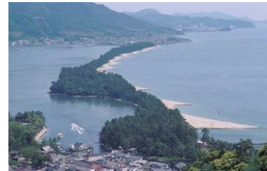
丹後天橋立大江山国定公園