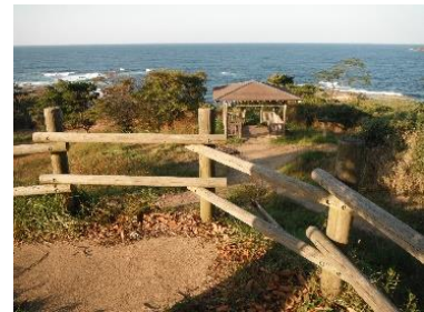
写真3-2-6 山陰海岸国立公園

概要：我が国の風景を代表するに足る傑出した自然の風景地（海中の景観地を含む）であって、環境大臣が関係都道府県及び中央環境審議会の意見を聴き、区域を定めて指定。公園利用施設の整備、管理や行為許可事務、届出受理を行う公園管理者は環境大臣