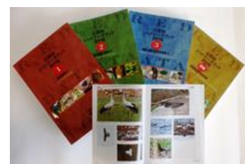
写真3-2-1 京都府レッドデータブック

府では府内における絶滅のおそれのある野生生物や保護を要する地形地質、学術上重要な自然生態系について、その現状や保全対策を複合的に把握し、府内の生物多様性を保全する施策の基礎的データとして活用するため、平成10年度から4年間かけて府レッドデータ調査を行い、平成14年6月に「京都府レッドデータブック」を発刊しました。その後10年余りが経過し、絶滅のおそれのある野生生物を取り巻く府内の環境も大きく変化したことから、平成25年度には野生生物編リストの改訂版を公表、平成27年度には近