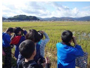
写真 3-2-15 自然観察会

府内の優れた自然を訪ねる自然観察会を平成29年度から、府内の小学校等と連携して開催しています。自然観察や生き物とのふれあいを通じて京都の自然の豊かさを伝えるとともに、府内の生物多様性の保全や自然保護について考えていただきました。