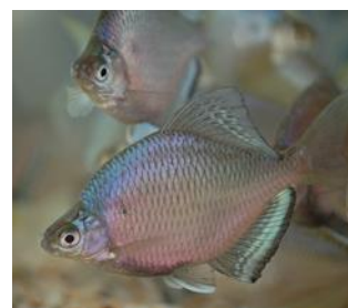
写真3-2-2 絶滅寸前種のイタセンパラ

また、アライグマやオオクチバス等による捕食や、チュウゴクオオサンショウウオと在来種との交雑等、外来種による影響も顕著になりました。一方で今回調査が進んだことにより、これまで府内では既に絶滅したと思われていた種の再発見や新たな生息地が発見された例もありました。