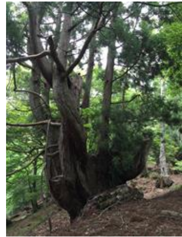
片波川源流域の伏条台杉