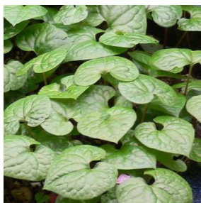
図1-8 葵祭で社殿や行列の装飾に使われるフタバアオイ