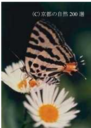
図 1-4 キマダラルリツバメが市街地で見られるのは非常に珍しい（哲学の道：京都市）