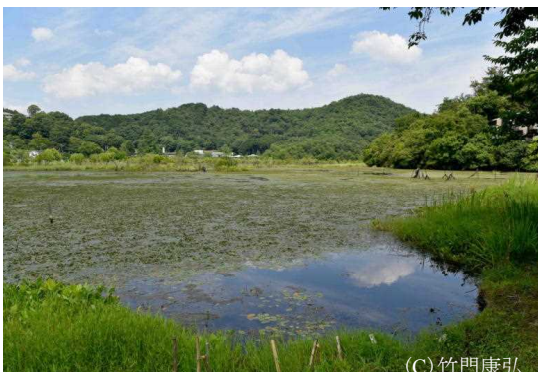
図 1-2 市街地に隣接しながら貴重な生物群集を残している深泥池（京都市）