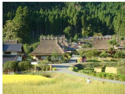
図 1-3 人と自然の共生の結果生み出された里山の風景（美山かやぶきの里：南丹市）