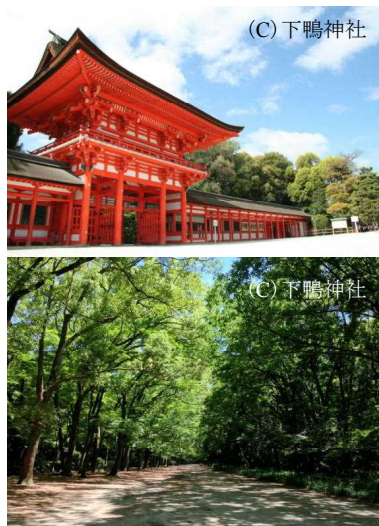
図 1-5 賀茂御祖神社（下鴨神社）とその境内に広がる「糺の森」（京都市）