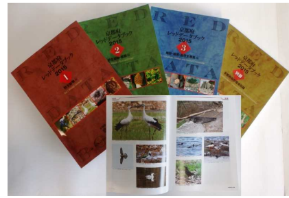
図3-16 府レッドデータブック

府レッドデータブック2015では、府内の野生生物を取り巻く環境が大きく変化したことから改訂を行いました。その結果、300種を超える野生生物が新たに絶滅のおそれがある種として掲載され、多くの種がより危険性の高いカテゴリーのランクへと移行するなど、府内においても生物多様性の危機が一層進行していることが明らかになりました。その大きな原因はニホンジカの急増や里山の放置等による下層植生の消失で、それに伴い絶滅のおそれのある野生植物の種が増え、そこに生息する昆虫や小型哺乳類も絶滅のおそれが高まっています。また、アライグマやブラックバス等による捕食や、チュウゴクオオサンショウウオと在来種との交雑等、外来種による影響も顕著になりました。一方で今回調査が進んだことにより、これまで府内では既に絶滅したと思われていた種の再発見や新たな生息地が発見された例もありました。