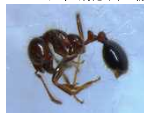
図3-25 ヒアリ（特定外来生物）