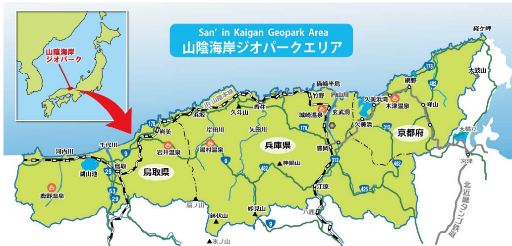
図3-20 山陰海岸ジオパークのエリア

府、兵庫県、鳥取県、京丹後市ほか関係市町等で組織した山陰海岸ジオパーク推進協議会（会長：豊岡市長）と連携し、ジオサイトの整備、学術調査研究活動の充実等を進めるとともに、環境学習体験やジオガイドの養成、観光振興等の取組を進めています。