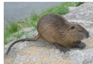
図3-22 ヌートリア（特定外来生物）

南米原産のヌートリアは、近年、京都市内を流れる鴨川で増加しており、生態系や景観上の点から問題となっています。人が餌を与えることが個体数増加の主な要因となっているので、府では餌やり禁止の普及啓発を行っています。24年度には餌やりが多い場所への看板の設置、動画サイトを利用した啓発を行ったほか、25～29年度は河川敷でのパトロールを実施し、生息状況の把握と餌やりをしている方への注意・指導を行っています。また、アライグマ防除の協議会体制を活用し、中丹・南丹・山城地域のヌートリア防除も行っています。