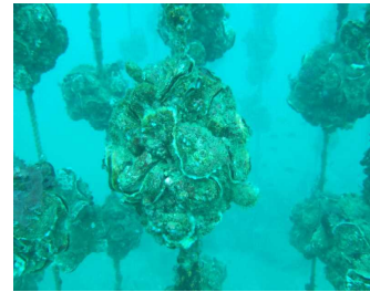
図3-26 イワガキの養殖

また、河川においては、漁業協同組合が、魚が産卵しやすい環境づくり等を通じて魚類の保護増殖に努めているほか、水辺に降りる道の管理や駐車スペースの確保等、釣りを通じて府民が川の自然に親しむ環境整備を行っていることに加え、近年では地域住民等とも連携して魚類の遡上促進や生物多様性の保全に寄与する活動も行われており、これらの取組を支援しています。