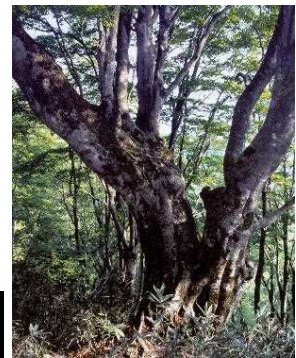
図3-19 府自然環境保全地域 (丹後上世屋内山地区)