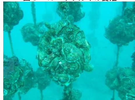
図3-13 イワガキの養殖

水産業においては、環境負荷の軽減を図るため、トリガイ・イワガキなど二枚貝の無給餌養殖を推進するとともに、魚類養殖については食べ残しを出さないよう適切な給餌に取り組んでいます。