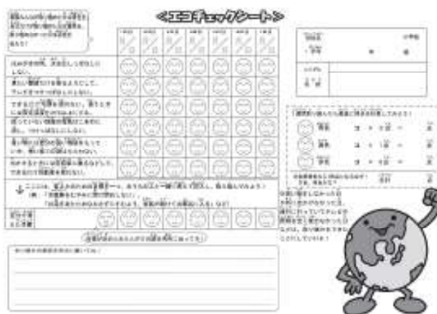
図3-2 エコ親子認定チェックシート

親子で行う家庭での省エネ等の取組を、ポイントを貯めるという楽しみを持って継続することにより、家族のふれあいを深めながら地球温暖化対策に対する意識の向上を図ることを目的とするもので、20年度は、前年度より70%近い増加となる約6,400組を「エコ親子」として認定しました。