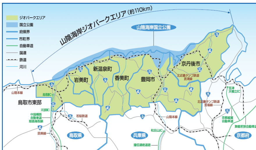
図3-14 山陰海岸ジオパークのエリア

京都府、兵庫県、鳥取県、京丹後市ほか関係市町等で組織した山陰海岸ジオパーク推進協議会(会長：豊岡市長)と連携し、ジオツアールート整備、大学等との連携による調査研究活動の充実などを進めるとともに、環境学習体験や学術交流の推進、観光振興等の取組を進めています。