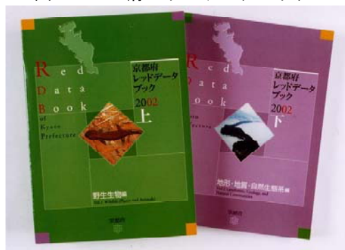
図3-11 府レッドデータブック