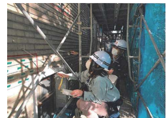
(5) 工事監理(外壁補修検査)