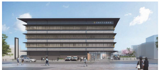
宇治警察署建替工事 完成予想図