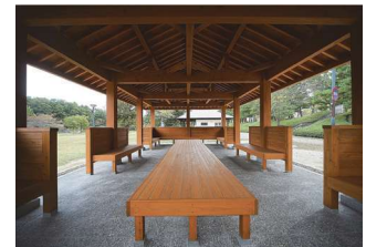
(4) けいはんな記念公園休憩所 (地域社会寄与)