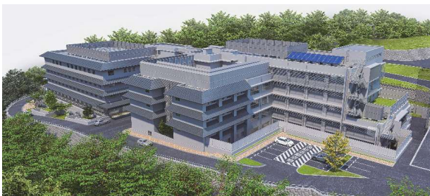
洛南病院建替工事 完成予想図