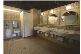
(3) けいはんな記念公園トイレ (だれもが利用しやすい)