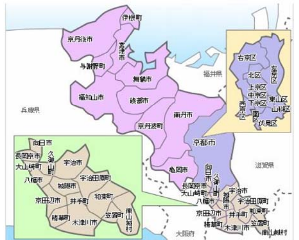
京都府内の行政区界