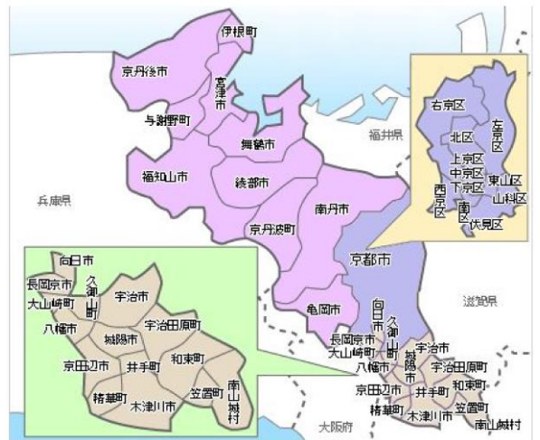
京都府内の行政区界