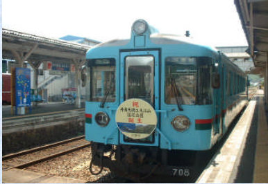
丹後天橋立大江山国定公園記念ヘッドマーク