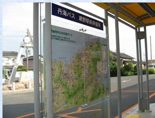
網野駅前停留所に公共交通マップを整備