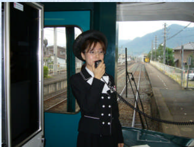
トレインアテンダント1名を初採用