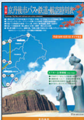
京丹後市 バス・鉄道・航空時刻表 【第3版】