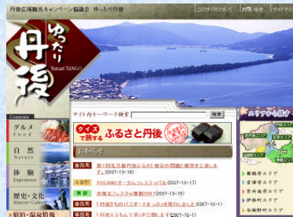
「ゆったり丹後」全面リニューアル