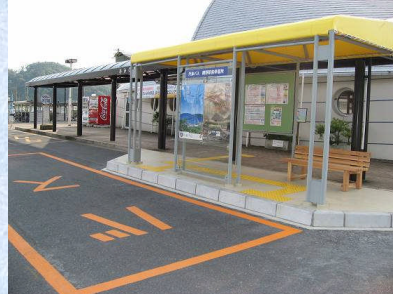
停留所を整備し観光情報も充実(網野駅)