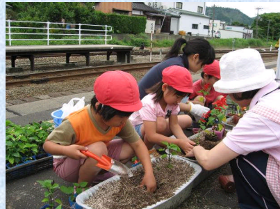
地元の子も植栽に参加(久美浜駅)