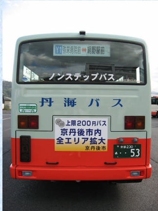
中型ノンステップバス (新規購入車両)