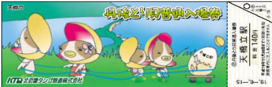
「丹後とり貝普通入場券」(天橋立駅用) 【H19.6～11】