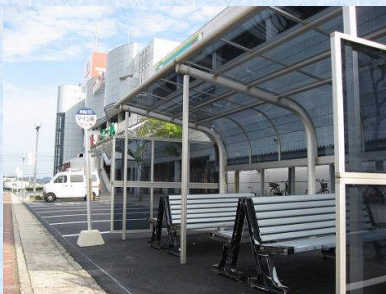
ショッピングセンター「マイン前」バス停新設