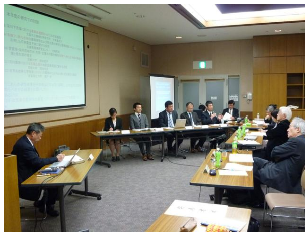
【平成24年度 成果報告会の様子】