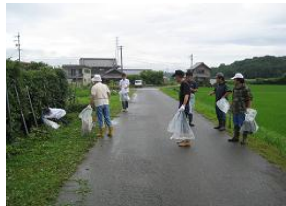
地域美化共同作業