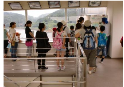
展望塔からの眺め