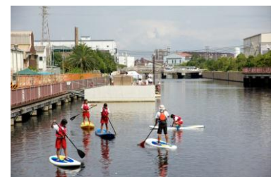
パドルボートの体験

尼崎臨海部を賑わいある地域にしていくため、尼崎運河を核としたまちづくりを進めています。県民に運河をもっと良く知ってもらうため、NPO法人が主体となり水面を利用した運河クルージングやパドルボートの体験活動を行っています。毎年秋には「うんぱく 尼崎運河博覧会」を開催しています。