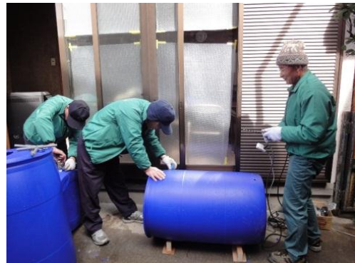
「たかつき天水くん」製作の様子 ②「たかつき環境市民会議 水環境保全グループ」(高槻市)