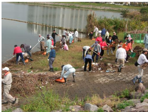
「狭山池クリーンアクション」の様子 ①「狭山池まつり実行委員会」(大阪狭山市)

同団体は、「憩いと潤いに恵まれた都市 高槻」を目指し、雨水利用の促進に向けた取組を行ってきました。食品メーカーから提供を受けた使用済みの樹脂製ドラム缶に蛇口・水面計・給排水管等を加え、雨水貯槽として利用できるように加工した「たかつき天水くん」を開発し、市の広報紙等で募った設置希望者に安価で提供しています。2007年から普及を進め、これまでの6年間で計390台を設置するなど、大切な資源として雨水を利用することで、環境保全に大きく貢献しておられます。