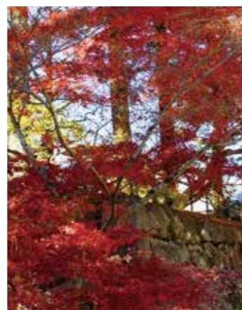
丹波亀山城跡の石垣

丹波亀山城跡…現在は宗教法人大本の本部になっています。見学は現地の受付で申し込みを。 南郷公園…丹波亀山城跡の公園。春の桜並木など四季折々の花が楽しめます。