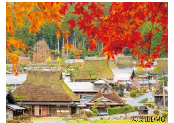
美山かやぶきの里

美山民俗資料館 主屋、納屋、倉の3棟で構成されており、地域の方から昔の暮らしを聞くことができるほか、縁側でゆっくりとかやぶきの景色を眺められる場所もあります。