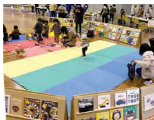
京都丹波子育て応援フェスタ