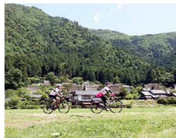
京都丹波サイクルルート