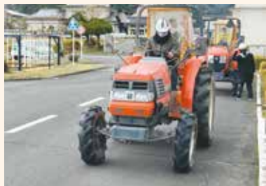
大型特殊自動車運転免許試験