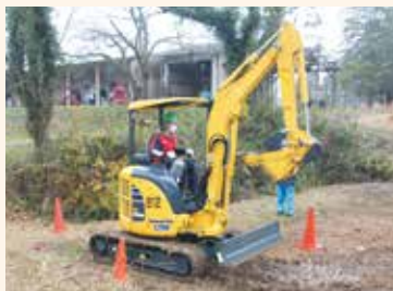
小型車両系建設機械運転技能講習