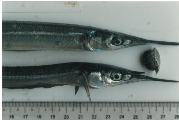
寄生され痩せたサヨリ(下)