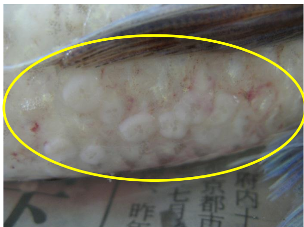
マダイの体表に寄生する様子

Benedenia seriolae , Neobenedenia girellae , Benedenia sekii