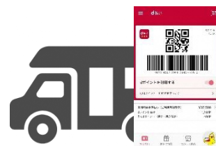
キッチンカーでの「d払い」体験