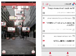
AR+「d グルメ」等での周辺案内「はなして翻訳」で多言語対応も