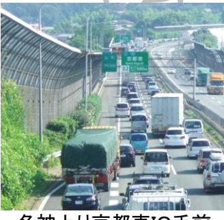
名神上り京都東IC手前