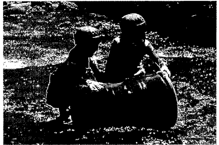
毎年 500 人以上の参加のある ドラム缶転がしタイムレース