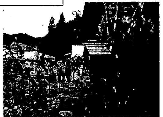
「みんなで作ったみんなの水車」