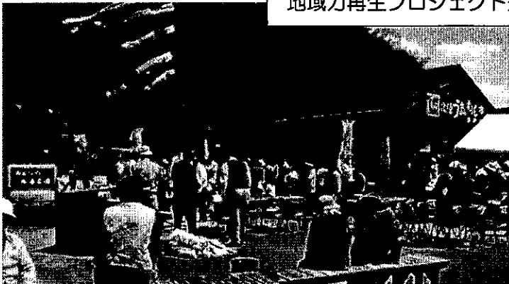
手作りで整備された「みんなの和楽家（わがや）」（農家レストラン）