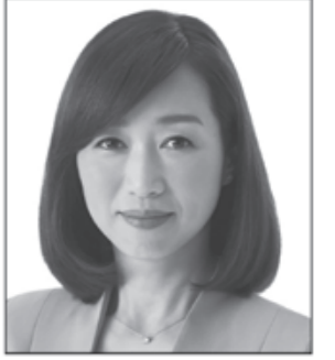
党首 積量子 しゃく りょう こ