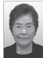
【肩書き・経歴】 元衆議院議員・憲法9条を守り広げる安藤野の会代表 【政策】 地域保健、学校給食無償化、地域公共交通