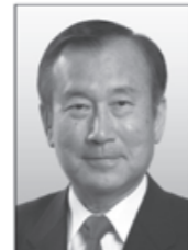
【肩書き・経歴】 前広島市長・元衆議院議員・数学者 【政策】 核廃絶への実行可能な地固作成。希望創り。