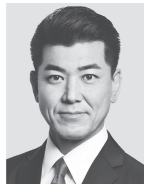
立憲民主党 代表 泉 健太