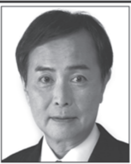
かわいたかのり 国民民主党 参議院国会対策委員長 ムダにしません 汗と税!