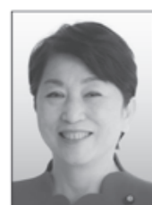
ふくしま みずほ 福島みずほ 【肩書き・経歴】 社民党党首・参議院議員・弁護士 【政策】 憲法をくらしに活かす政治を実現します!