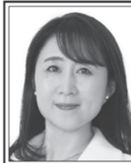
やた わか子 国民民主党 副代表 あなたと動けば、 未来は変わる。