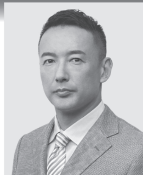
れいわ新選組 代表