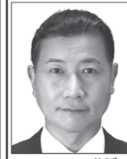
たるい 良和 元衆議院議員 表現の自由を守る。 日本V字回復やったるい