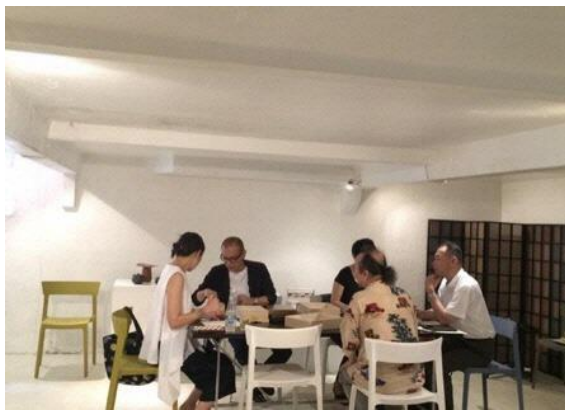
地下ショールームでの開発会議

○パリ現地等の情報やデザイナーのアドバイスを取りまとめ、商品開発等のサポートを総合的に実施します。必要に応じて 1 事業者あたり 1~2 点の製品の図面及びイメージパース作成などデザインサポートを実施します。また地下 1 階の 15 坪ショールームにおいて、開発製品の展示や開発会議も開催します。