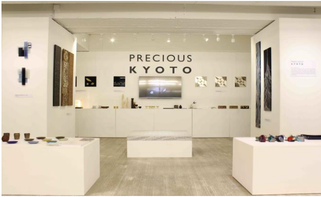
Maison Wa での展示風景