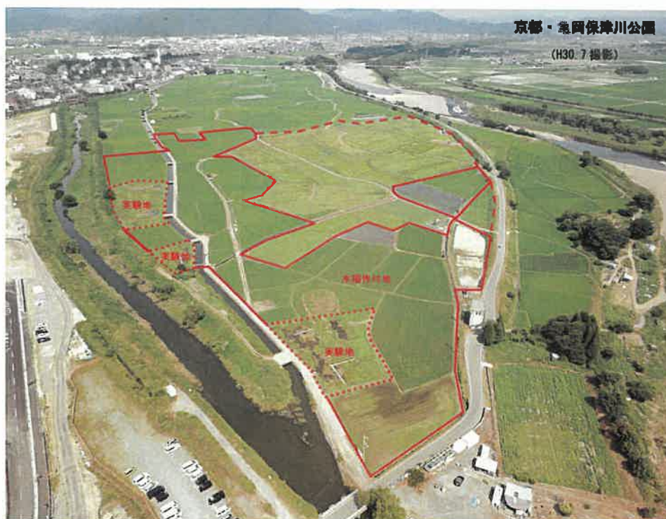
図2 京都・亀岡保津川公園予定地現況写真（平成30年7月撮影）