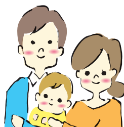
京都市内在住、又は在勤の共働き家庭