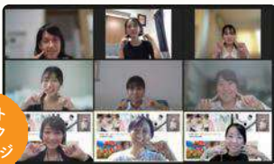
ゲストトークイメージ

学生がご家庭を訪問しお子さんと遊んだりしながらインタビューをさせていただきます。