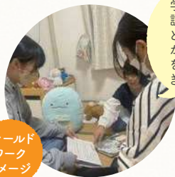
フィールドワークイメージ

学生がご家庭を訪問しお子さんと遊んだりしながらインタビューをさせていただきます。