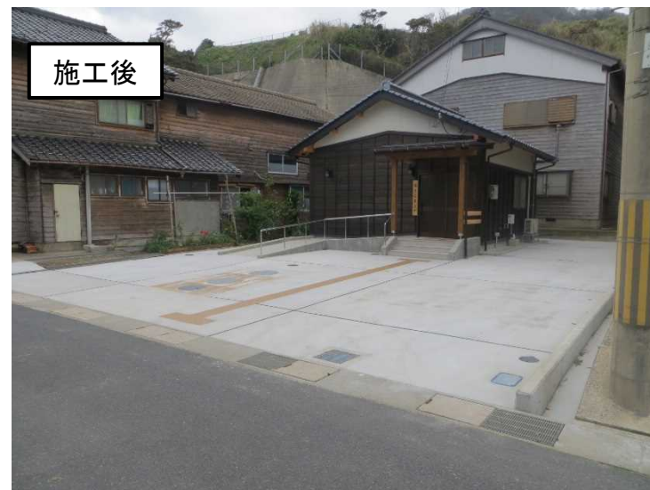
区民交流広場整備助成事業 (丹後町袖志)