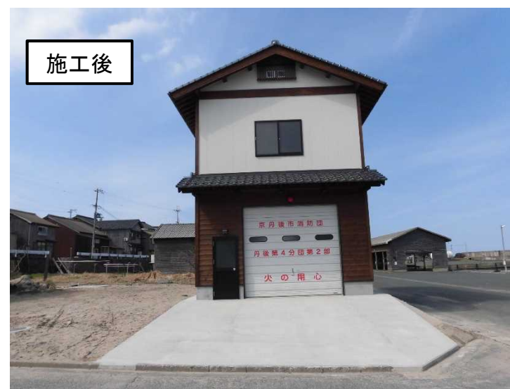
中浜消防車庫整備事業 (丹後町中浜)