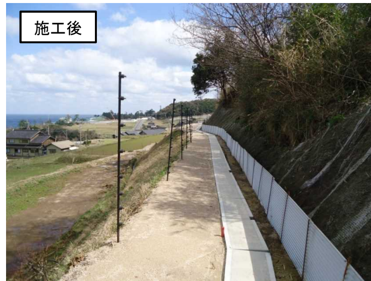
尾和用水路改修事業