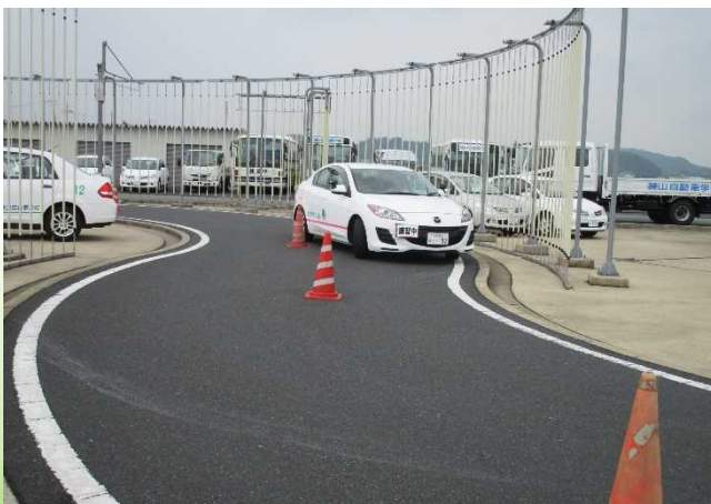
実車講習の様子（峡路走行）