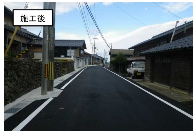
尾和中央線改良事業 (丹後町尾和)