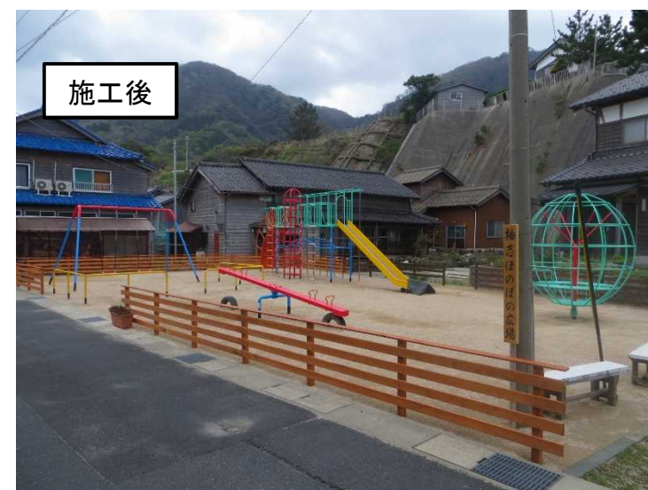
親子ふれあい広場整備助成事業 (丹後町袖志)