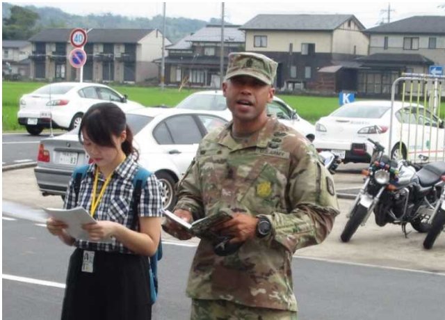
講習に先立ち挨拶する先任曹長

今回の講習会では、動物や歩行者の飛び出しへ対応する危険回避の練習や、米軍関係者が苦手だと感じている狭い道の通行を練習をしました。参加者は熱心に講習に取り組み、交通安全への意識を高めました。