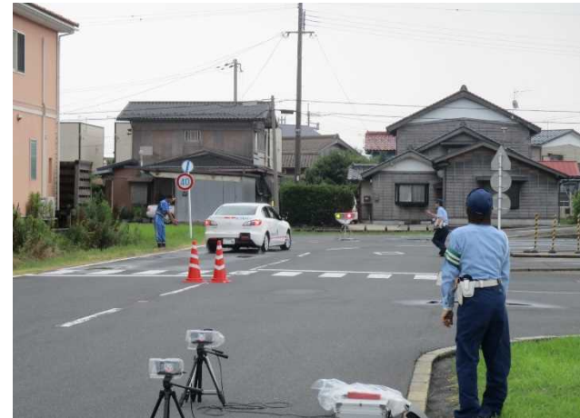
実車講習の様子（危険回避）