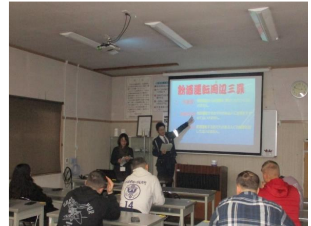
京丹後警察による座学講義