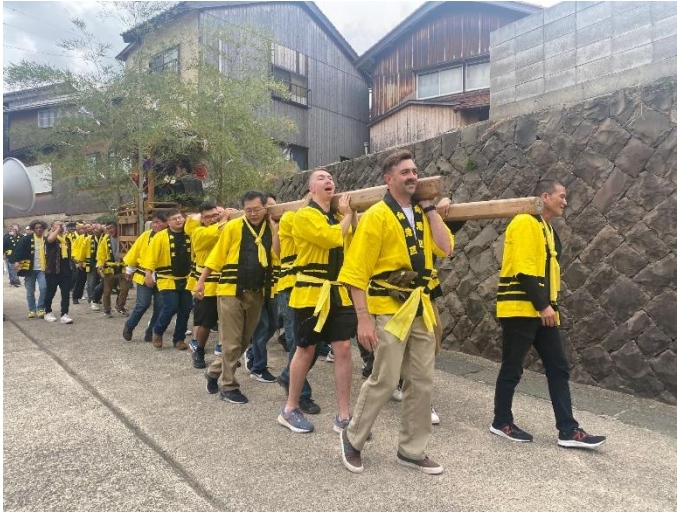
秋祭りへの参加 (2023年10月8日(日))