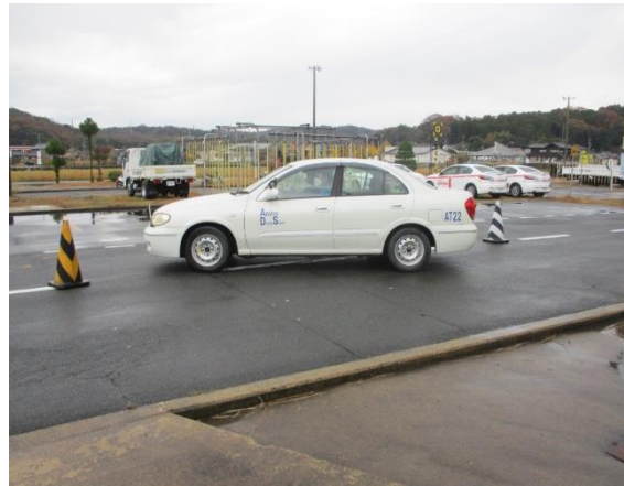
車幅の感覚を磨くパイロンスラローム