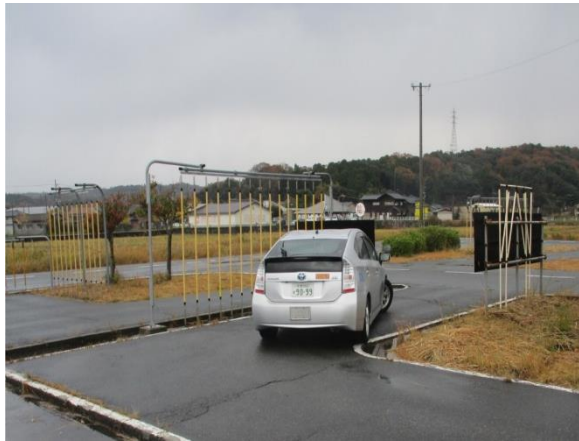
クランクコースの走行