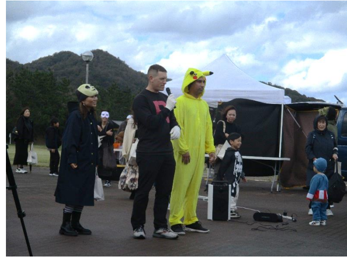
八丁浜シーサイドパーク