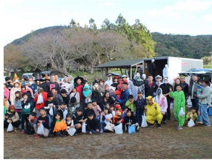
宇川アクティブライフハウス