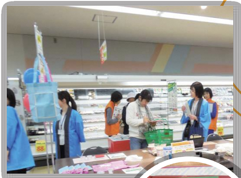
2019年11月に 適塩キャンペーンを 実施しました

府民の1日あたりの食塩摂取量の平均は9.9gと目標よりも高いのが現状なんです。「適塩」に対して少しでも気にかけていただければと、スーパーにしがきと連携し「きょうと適塩プロジェクト」を開始しました。13品目の惣菜に塩分を表示しています。お買い物の参考にしていただいね。