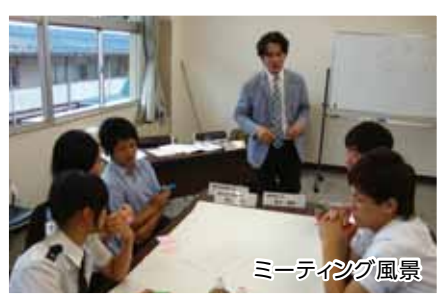
ミーティング風景

農林商工部企画調整室(食関係) TEL 0772-62-4315 FAX 0772-62-4333 企画振興室(文化ステージ) TEL 0772-62-4300 FAX 0772-62-5894