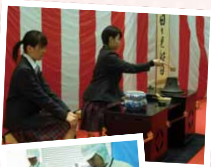
昨年の様子 上)峰山高校 左)海洋高校