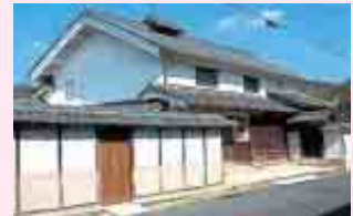
与謝野町(旧加悦町) 旧尾藤家住宅