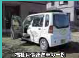
福祉有償運送車の一例

自宅から病院・施設等に通院等をする場合に、これまでの「福祉タクシー」等に加えて、高齢者や身体に障害のある方で単独ではタクシー等の公共交通機関の利用が困難な方を対象に、社協やNPO等による「福祉有償運送」のサービスも道路運送法の許可を得て、4月から開始されます。