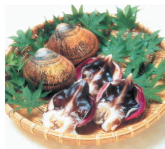
豊かな水産ブランド (丹後とり貝)