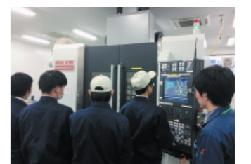
未来を担う人づくり (地元高校生のインターンシップ)