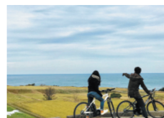
eバイクを活用した 新たな観光振興