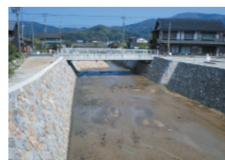
河川整備による強靱化 (加悦奥川)