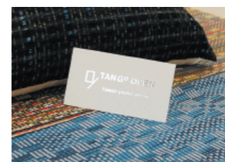
丹後織物の高い技術を示すロゴ 「TANGO OPEN」