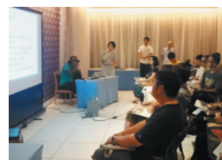
総合的な移住支援 (移住セミナー)