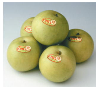
甘くてみずみずしい果物 (京たんご梨)