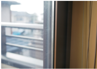
▲夏の暑さを遮る複層Low-Eガラス。ガラス板の間にはアルゴンガスが充填され、断熱性が高くなっています。

の方が減っていますね。冬は全館ガス温水床暖房なので、少し増えています。快適さが全然違います。