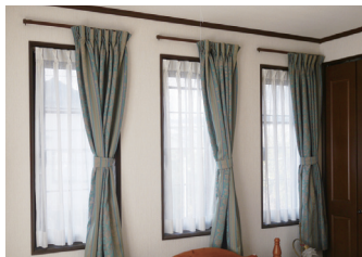
▲高断熱高气密というと窓の少ないイメージ？いえいえ、Hさん宅は充分な窓が設けられ、明るく開放的です。

像を見せてもらい、天井から熱が逃げていない、つまり断熱性・気密性が高いということを納得しました。