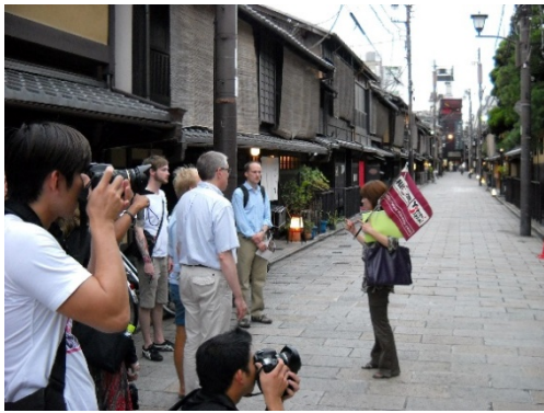
京都の花街「祇園」での ウォーキングツアー案内風景