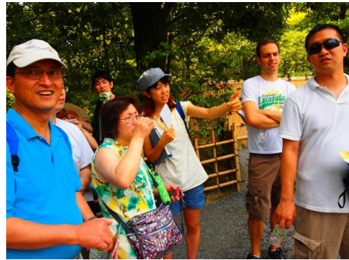
大学生のボランティアガイド による案内風景