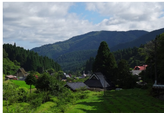
左京区北部山間地域の風景