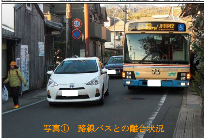
写真① 路線バスとの離合状況