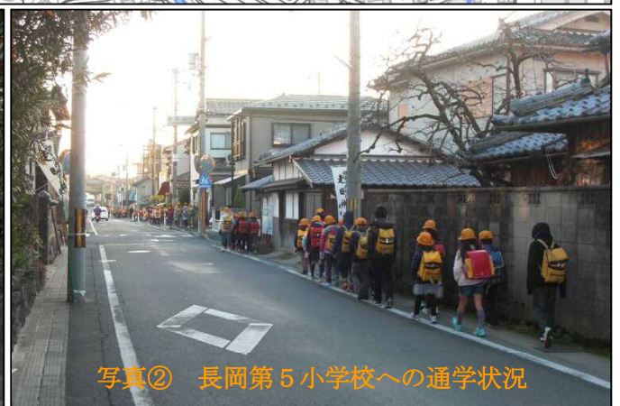
写真② 長岡第5小学校への通学状況