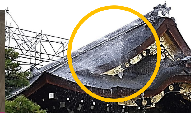
延焼防止のための放水設備